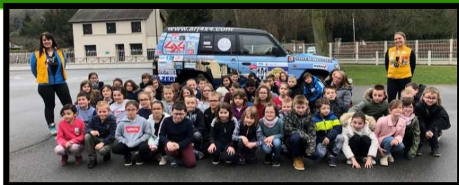
Participation à l'action solidaire du trek Elles Marchent 2018